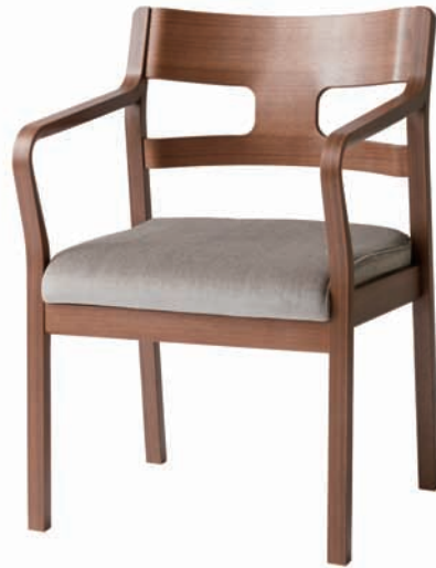
アームチェア・ウォールナット

張地：スタンダード ¥38,000- (税抜) 張地：アクアクリーン ¥45,000- (税抜)