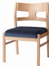
アームレスチェア・ブナ