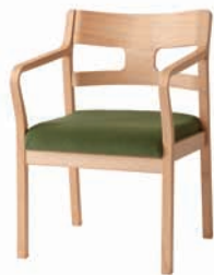
アームチェア・ブナ